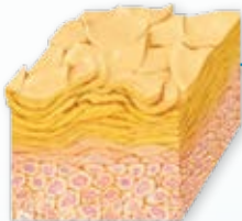
Trockene, schuppige Oberhaut (Epidermis)

Die „junge“, vitale Haut ist durch ihre natürliche Beschaffenheit „elastisch“ und von leicht glänzender, glatter Beschaffenheit. Sie besitzt genügend Fette & Eiweisse und kann dadurch sehr gut Feuchtigkeit speichern.