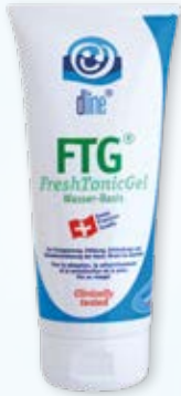
Wasserbasis Lipidanteil 8%

AQUA (WATER), BUTYLENE GLYCOL, METHYLPROPANEDIOL, UREA, MENTHYL LACTATE, DECYL GLUCOSIDE, HYDROXYPROPYL METHYLCELLULOSE, CAFFEINE, MENTHOL, HYDROXYETHYLCELLULOSE, SODIUM CO-COAMPHOACETATE, RUTIN, CRATAEGUS MONOGINA (LEAF) EXTRACT, PANTHENOL, TOCOPHERYL ACETATE, LACTIC ACID, GLYCERIN